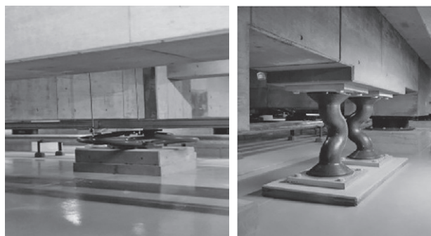
図3 鋼棒ダンパーと鉛ダンパー

この大きく変形する層に、運動エネルギーを熱エネルギーに変換するデバイスを取り付けます。多くの建物で、金属材料の塑性変形を利用した鋼棒ダンパーや鉛ダンパーが用いられてきました。最近では、車のショックアブソーバーと同じ原理のオイルダンパーが多く用いられるようになってきました。免震構造は、特定の層以外は変形しない方が良いので、鉄筋コンクリート構造との相性が良いシステムになります。