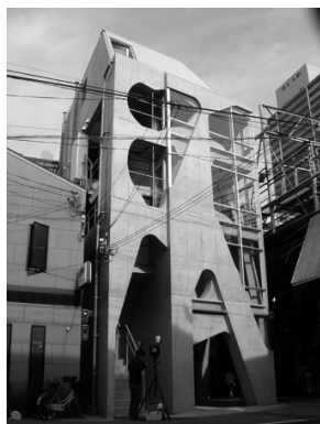
写真1 竣工した建築物