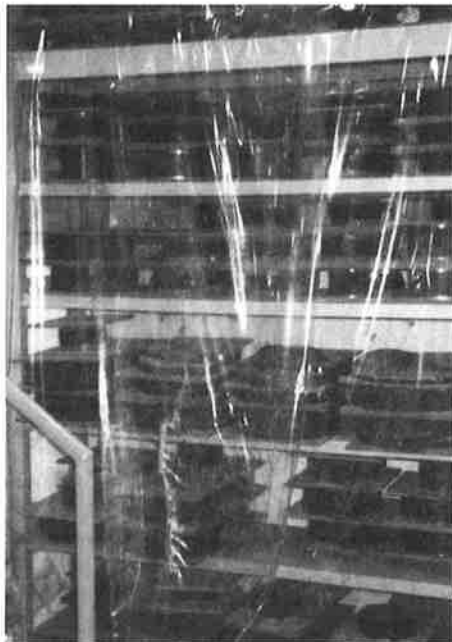
写真-1 柵に置かれた数多い試験体