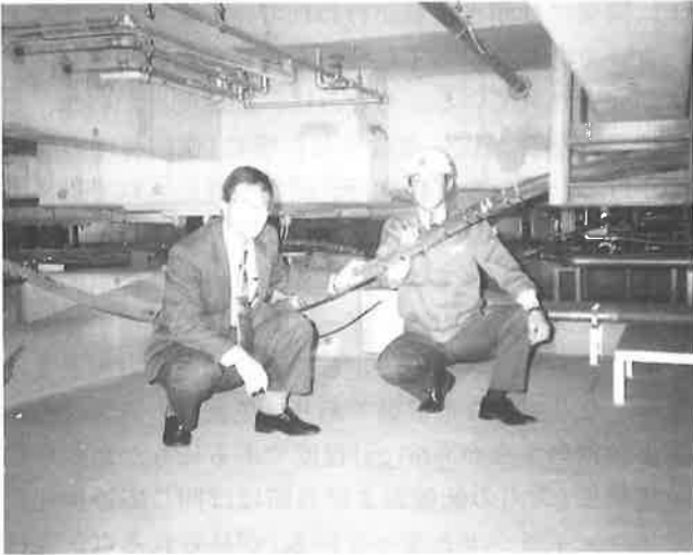
ピット中央部の自由振動実験用ワイヤ

最後にTC棟を案内してもらい一般のRC造とは少し違うな、との印象を持ったもう一点は竣工6年目にして実にコンクリートのひび割れが少ない事である。