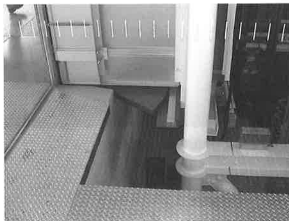
写真-3 エレベータ部クリアランス