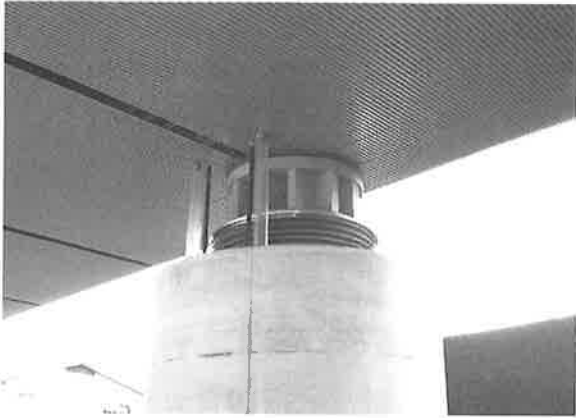
写真-4 独立ピア上の積層ゴム

写真-4は、ピア上の積層ゴムです。透明のパイプはドレーン管、天井右側に見られる四角の蓋状のものは、積層ゴムを取り替える場合のジャッキアップ位置であるとのことでした。