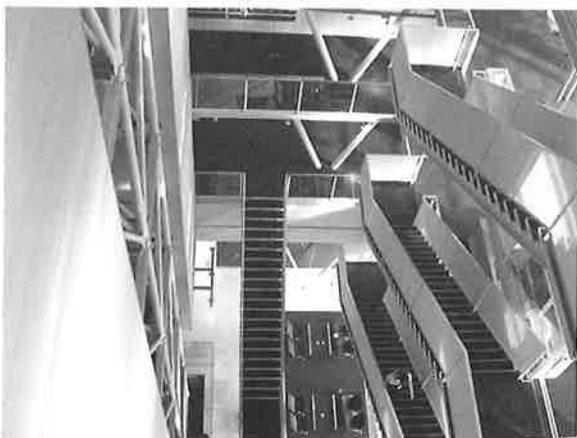
写真-6 内部階段と吹き抜け部

写真-6は、6階から俯瞰した吹き抜け部を示します。全層に亘る吹き抜け空間が設けられています。