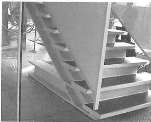
写真-5 内部階段の1階立上り部

写真-5は、内部階段の1階立上り部を示します。2階は固定し、1階ではテフロンを挟んだ滑り支承で受けています。