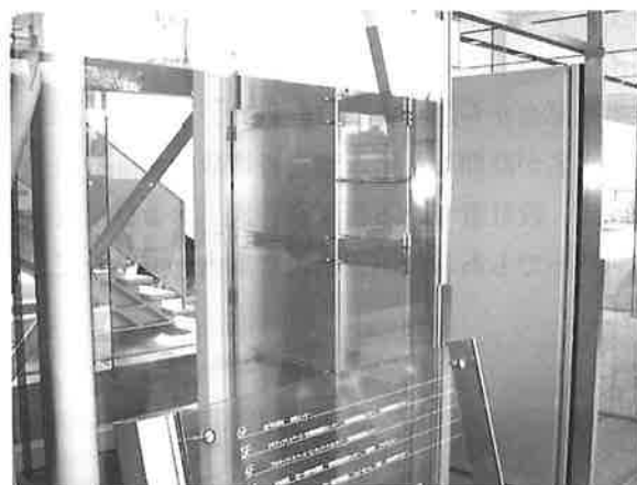
写真-2 エレベータ部

写真-2は、シースルーエレベータの様子です。背後も含めてシースルーとなっており、裏側にある内部階段も見渡せます。写真-3は、エレベータと1階の取合部を示します。エレベータは上部構造から吊られているため、1階とクリアランスを設けています。