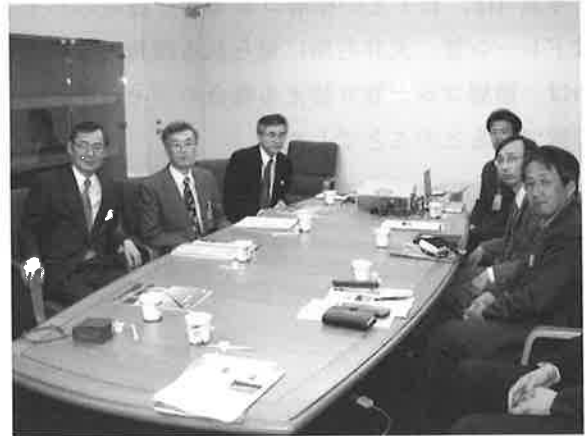
写真-9 建物説明状況

A：設備情報も含めて全ての部材情報を持っているため、建て方位置の確認、鉄骨重心の算定などを簡単に行うことができます。建て方に際しては、建て方の方法、順番などをシミュレーションによって繰り返し検討し、施工に生かすことができました。