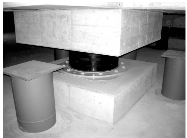
写真3 (2) 直接基礎部分の免震層