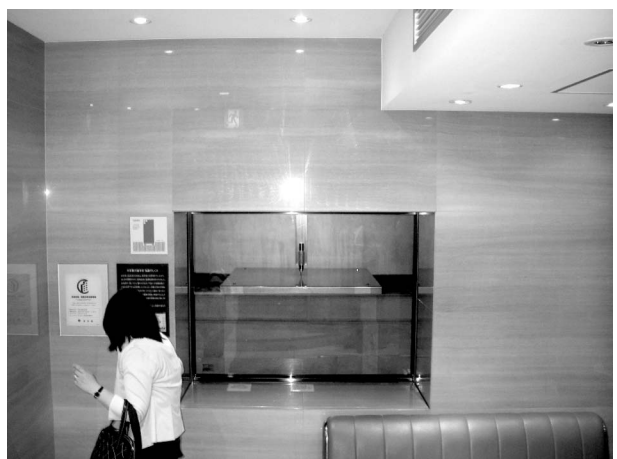
写真8 免震見学コーナー