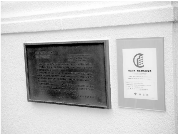
写真9 東京都選定歴史的建造物の銘板(左)と「耐震診断/耐震改修済建築物」プレート