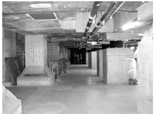
写真2 (1) 松杭部分の免震層 (左側：弾性すべり支承)