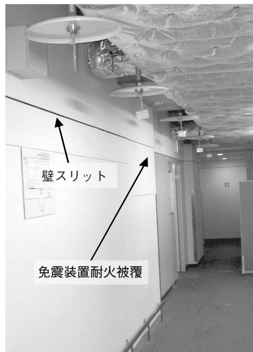
写真4 (3) 深礎杭部分の中間階免震