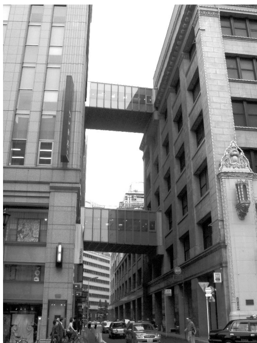
写真6 新館との連絡通路

会員各位におかれましても、休日のお買い物とあわせてご見学をされてはいかがでしょうか。