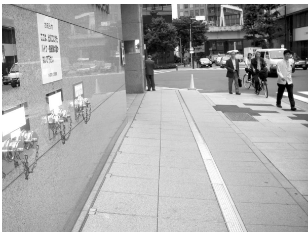
写真5 外部仕様の免震エキスパンション

設備計画では、キャスター支持タイプの免震継手の作動スペース内に障害となるものを置かれないように、作動範囲を明示するなど改修後の維持管理に対しても細やかな配慮をされています。