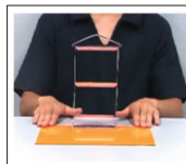
免震装置: ↑無 ↓有

※当日13:00～先着順。但し、20名限定 事前申込みを受付けません(当会HPにて)